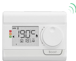
Télécommande RF optionnelle